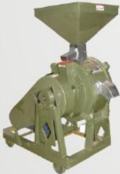
Vertical Stone Flour Mill