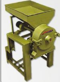
MS Hammer Pulverizer