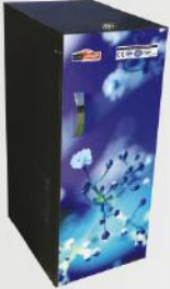
Stoneless Flour Mill