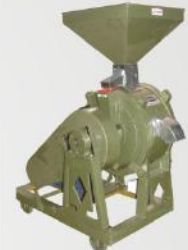
Vertical Stone Flour Mill