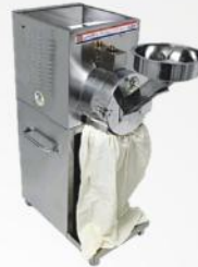
SS Pulverizer Heavy Duty